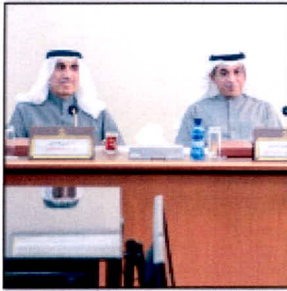
مجلس العارضي وزير عيسى الاحمداني خلال اجتماع لجنة شؤون التعليم